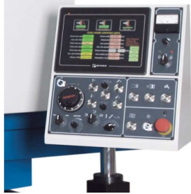
Programování brusných cyklů probíhá prostřednictvím dotykové obrazovky