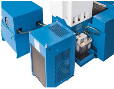
Externí hydraulický agregát a chladič oleje pro stabilitu teploty v trvalém provozu