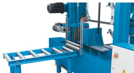
Stabilní zavázeční válečkový dopravník a vedení materiálu pro svazek obrobků